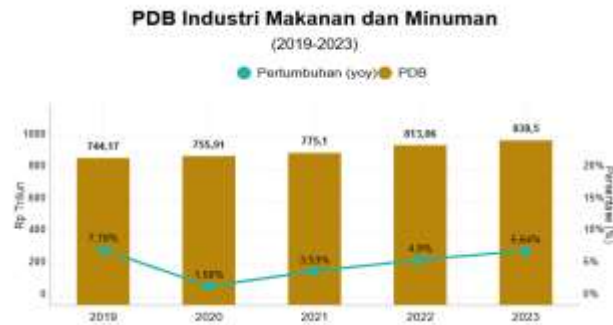
Gambar 1.2 Data PDB di Industri Makanan dan Minuman

signifikan menjadi 1,58%. Setelah kontraksi akibat pandemi, sektor ini mulai pulih pada tahun 2022 dan 2023. Pada tahun 2022 dengan pertumbuhan mencapai 4,9%, dan tahun 2023 dengan pertumbuhan mencapai 5,64% (BPS, 2023).