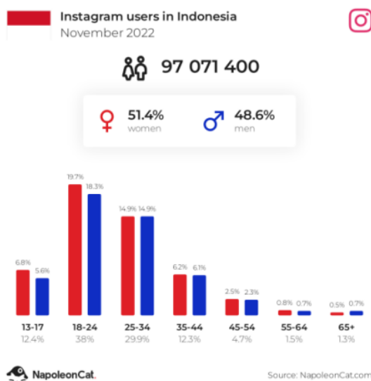
Gambar 1. Data Pengguna Instagram di Indonesia