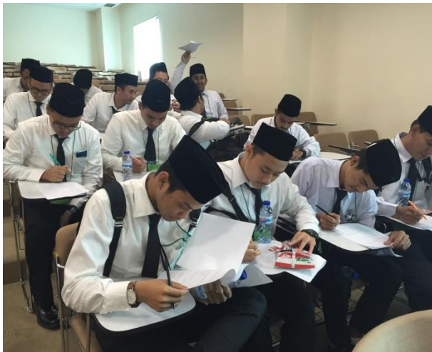
FOTO PELAKSANAAN PENELITIAN